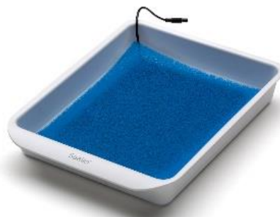
Kit vaschetta come controelettrodo